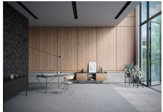
「3M™ ダイノック™ フィルム」施工イメージ