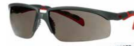
S2002SGAF-RED Lins: Grå | Färg på båge: Grå/röd