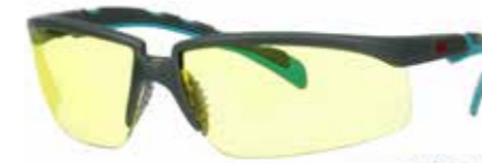
S2003SGAF-BGR Lins: Orange | Färg på båge: Grå/Blå-Grön