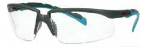
S2001SGAF-BGR Lins: Klar | Färg på båge: Grå/Blå-Grön