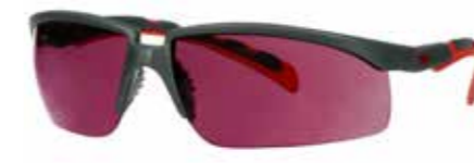
S2024AS-RED Lins: Röd spegel | Färg på båge: Grå/röd