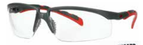
S2001SGAF-RED Lins: Klar | Färg på båge: Grå/röd