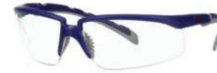
S2001AF-BLU Lins: Klar | Färg på båge: Blå/grå