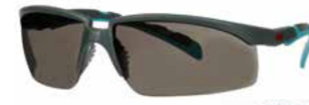
S2002SGAF-BGR Lins: Grå | Färg på båge: Grå/Blå-Grön