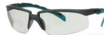
S2007SGAF-BGR Lins: I/O-grå | Färg på båge: Grå/Blå-Grön