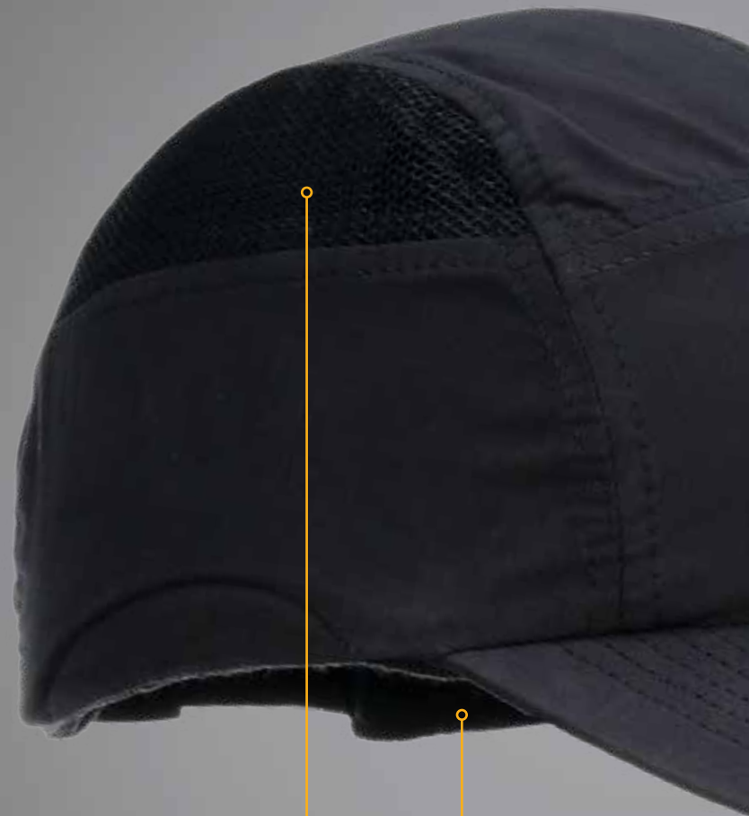
Ventilación de aire