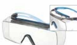
SF3701XSGAF-BLU Scheibe: Klar Rahmenfarbe: Grau/blau