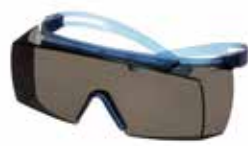
SF3702SGAF-BLU Scheibe: Grau Rahmenfarbe: Blau/blau