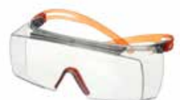
SF3701SGAF-ORG Scheibe: Klar Rahmenfarbe: Grau/orange