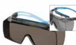
SF3702XSGAF-BLU Scheibe: Grau Rahmenfarbe: Grau/blau