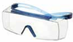
SF3701ASP-BLU Scheibe: Klar Rahmenfarbe: Blau/blau