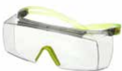
SF3701SGAF-GRN Scheibe: Klar Rahmenfarbe: Grau/limettengrün