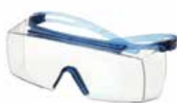
SF3701SGAF-BLU Scheibe: Klar Rahmenfarbe: Blau/blau