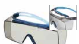
SF3707XSGAF-BLU Scheibe: Graue Scheibe für Innen-/Außenbereich Rahmenfarbe: Grau/blau