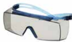
SF3707SGAF-BLU Scheibe: Graue Scheibe für Innen-/Außenbereich Rahmenfarbe: Blau/blau