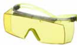
SF3703SGAF-GRN Verres : Jaunes Couleur de monture : Grise/Citron vert