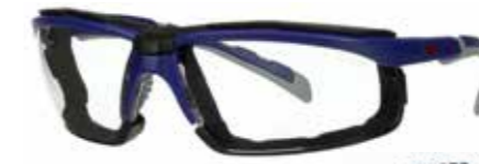
S2001SGAF-BGR-F Lens: helder | Montuurkleur: grijs/blauwgroen