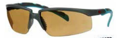
S2005SGAF-BGR Lens: bruin | Montuurkleur: grijs/blauwgroen