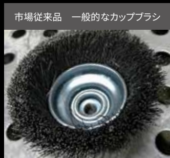
市場従来品 一般的なカップブラシ