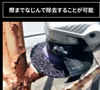
際までなじんで除去することが可能