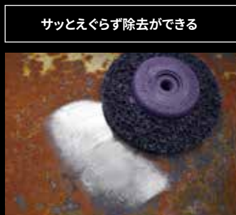
サッとえぐらず除去ができる