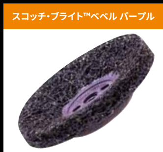
スコッチ・ブライト™ベベルパープル