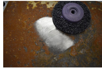
きついサビもサッと落とすことができる