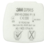
D7915 P1 R