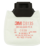
D3135 P3 R