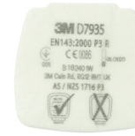
D7935 P3 R