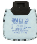
D3128 P2 R/ Contre les odeurs gênantes de vapeurs organiques et gaz acides