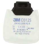
D3125 P2 R