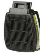
D8094 ABEK3 R