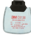
D3138 P3 R/ Contre les odeurs gênantes de vapeurs organiques et gaz acides