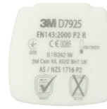
D7925 P2 R