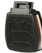
D8095 A2P3 R