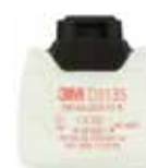
D3135 P3 R