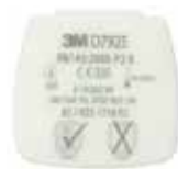
D7925 P2 R