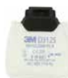
D3125 P2 R