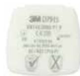
D7915 P1 R