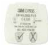
D7935 P3 R