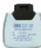
D3128 P2 R/ Contre les odeurs gênantes de vapeurs organiques et gaz acides