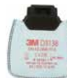
D3138 P3 R/ Contre les odeurs gênantes de vapeurs organiques et gaz acides