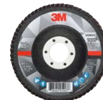
3M™ Lamellen- schijven 769F

TIP 5: 3M™ Cubitron™ II lamellenschijven 967A bieden de hoogste productiviteit bij matige tot hoge belastingen, 3M™ Cubitron™ II lamellenschijven 969F zelfs bij zware toepassingen. Als voordeliger alternatief levert de 3M™ lamellenschijf 769F uitstekende prestaties.