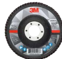
3M™ Lamellen- schijven 769F