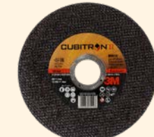
3M™ Cubitron™ II Doorslijpschijven