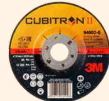
3M™ Cubitron™ II Afbraamschijven