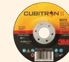
3M™ Cubitron™ II Cut & Grind Snij-en afbraamschijven