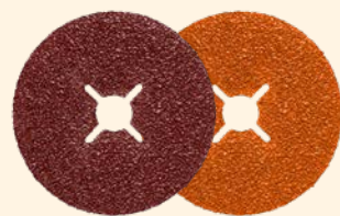
3M™ Cubitron™ II Fiberschijven 982C | 987C