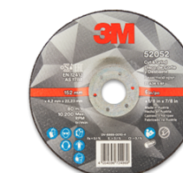
3M™ Cut & Grind Snij-en afbraamschijven

TIP 6: Hoe sneller ze draaien, desto beter doorslijpschijven presteren. Daarom is gereedschap dat de snelheid kan handhaven doorslaggevend voor het resultaat. OPGELET: Het opgegeven maximale toerental mag niet overschreden worden!