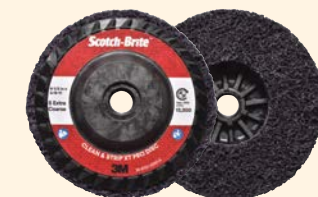
Scotch-Brite™ Clean & Strip Pro schijven