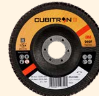
3M™ Cubitron™ II Lamellenschijven 967A | 969F