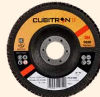
3M™ Cubitron™ II Lamellenschijven 967A | 969F