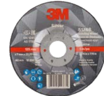
3M™ Silver Afbraamschijven