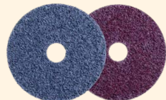
Scotch-Brite™ Light Grinding and Blending Schijven GB-DH