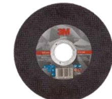
3M™ Silver Doorslijpschijven