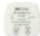
D7925 P2 R