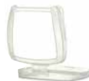
D701 Suodattimen kiinnike

HF-800-sarjan puolinaamarissa ja siihen liittyvissä suodattimissa on alle 5 mbar, sisäänhengitysvastus, kun hengitysvirtaus on jatkuvasti 95 l/min.