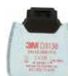
D3138 P3 R/ Hajuhaittoja aiheuttavat orgaaniset höyryt ja happamat kaasut