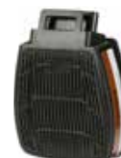
D8095 A2P3 R