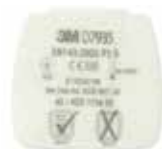
D7935 P3 R