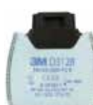
D3128 P2 R/ Hajuhaittoja aiheuttavat orgaaniset höyryt ja happamat kaasut

Hiukkassuodattimet, joissa on hajusuodatus orgaanisilta höyryiltä ja happamilta kaasuilta HTP-arvoon saakka, sekä otsonilta enintään 10-kertaisina pitoisuuksina haitalliseksi tunnetun pitoisuuden raja-arvoon (HTP) saakka.