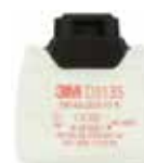
D3135 P3 R