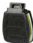
D8094 ABEK3 R