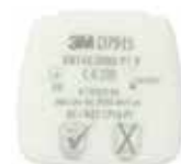
D7915 P1 R