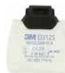
D3125 P2 R