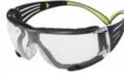
SF401AF-FM Transparente, antirayaduras y antiempañó, con Sello de Espuma