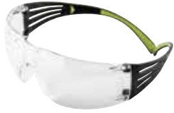
SF401AF Transparente, anti rayaduras y anti empañó