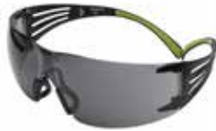
SF402AF Gris, anti rayaduras y anti empañó