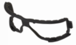
SF-FOAM Repuesto Marco de Espuma para Serie 200 y 400