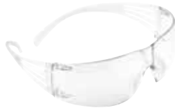
SF201AF Transparente, antirayaduras y antiempañó