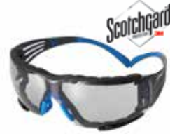
SF407SGAF-BLU-F In/ Out, con recubrimiento Scotchgard™, Sellado