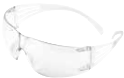
SF201AS Transparente, anti rayaduras