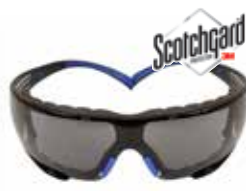
SF402SGAF-BLU-F Gris, con recubrimiento Scotchgard™, Sellado