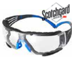
SF401SGAF-BLU-F Transparente, con recubrimiento Scotchgard™, Sellado