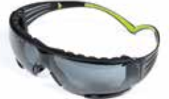
SF402AF-FM Gris, antirayaduras y antiempañó, con Sello de Espuma