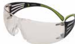
SF410AS In/Out, anti rayaduras