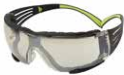
SF410AS-FM In/ Out, antirayaduras con Sello de Espuma