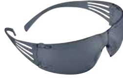
SF202AF Gris, anti rayaduras y anti empañó