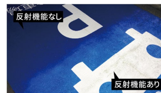
反射機能があると夜間でも安心