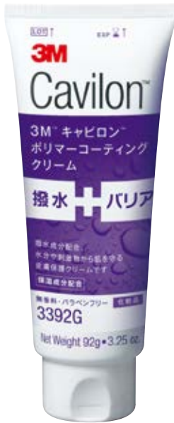
大容量で経済的なレギュラーサイズ 3392G