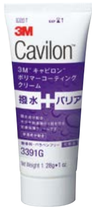
患者様一人一人に使いやすい少量サイズ 3391G