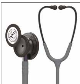
5873 Rökgrått bröststycke, grå slang, lilagrå stam och rökgrå öronbyglar