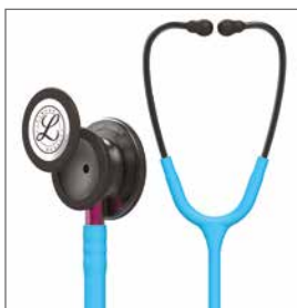
5872 Rökgrått bröststycke, turkos slang, rosa stam och rökgrå öronbyglar