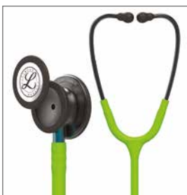
5875 Rökgrått bröststycke, limegrön slang, blå stam och rökgrå öronbyglar