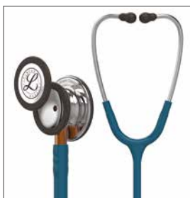
5874 Bröststycke med spegelfinish, karibienblå slang, orange stam och öronbyglar med standardfinish