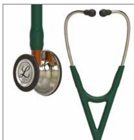
6206 Blankpolerat champagnefärgat bröststycke, mörkgrön slang, orange stam och champagnefärgade öronbyglar