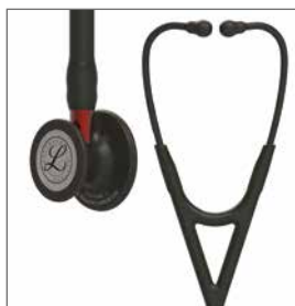
6200 Svart bryststykke, svart slange, rød stamme og svart headset