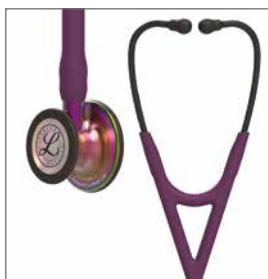
6205 Regnbuefarget bryststykke, plommefarget slange, lilla stamme og svart headset