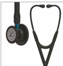
6201 Svart bryststykke, svart slange, blå stamme og svart headset