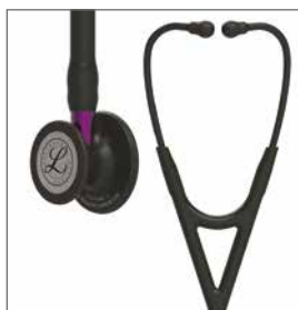
6203 Svart bryststykke, svart slange, lilla stamme og svart headset