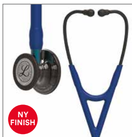
6202 Smoke finish bryststykke med høyglanset finish, marineblå slange, blå stamme og svart headset