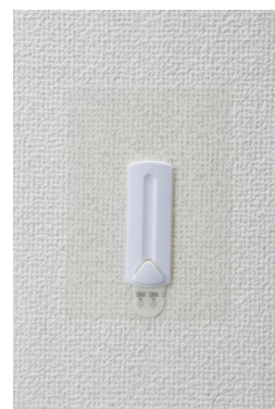
コマンド™ フック 壁紙用 フォトフレーム（ひもタイプ）用