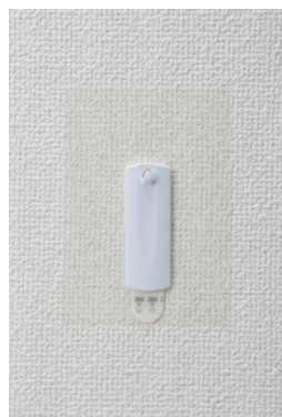
コマンド™ フック 壁紙用 フォトフレーム（金具タイプ）用