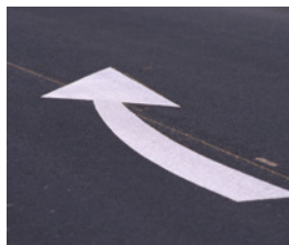
Flèches de rabattement

Le marquage 3M™ Stamark™ A380ESD aussi adapté aux applications plus complexes.