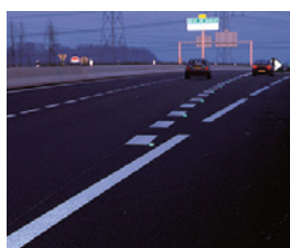
T25U / Axes / Rives