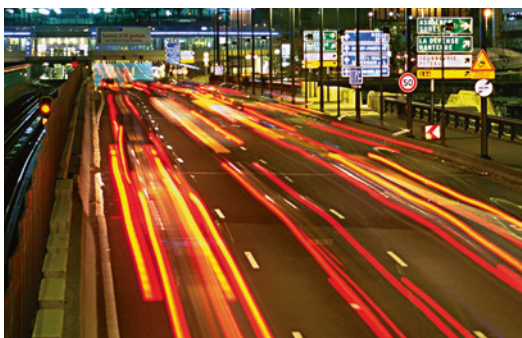
Visibilité des routes

La blancheur et la grande durée de vie de notre produit offrent aux automobilistes une visibilité renforcée de jour comme de nuit tout en réduisant les risques d'accidents.