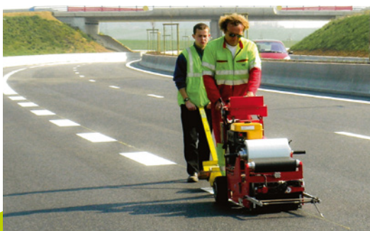
Temps d'intervention diminué