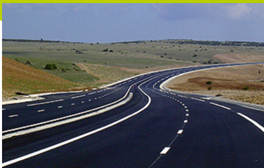
Coûts d'entretien limités

Avec notre protocole de pose en 5 étapes, il n'a jamais été aussi simple de marquer !