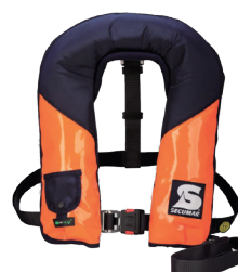
Golf 275 AS (Référence produit 13805)

Compatible pour une utilisation avec les modèles de dispositifs de flottaison personnel Secumar suivants :