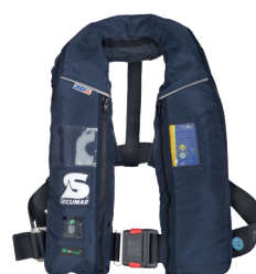
Alpha 275 AS Solas (Référence produit 14824-01)