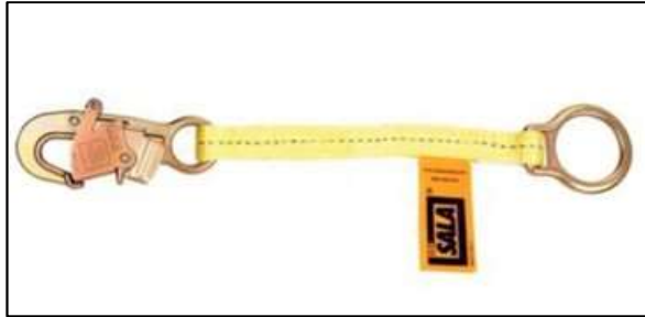
3M ID 70007438503/3M DBI-SALA® PN 1231117

3M Fall Protection has received a series of inquiries regarding the use of dorsal D-ring extenders with Leading Edge SRL's in environments where sharp edges are present. Examples of 3M dorsal D-ring extenders are shown below, but the concern applies to all dorsal D-ring extenders, regardless of the supplier/manufacturer: