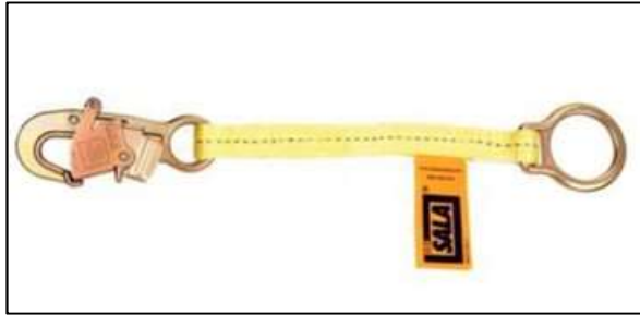
3M ID 70007438503/3M DBI-SALA® PN 1231117

La línea de productos de Protección contra Caídas de 3M ha recibido una serie de consultas respecto al uso de los extensores de anillo D dorsal con anticaídas autorretráctil (Self-Retracting Lanyard, SRL) de bordes frontales en entornos donde hay bordes filosos. A continuación presentamos dos ejemplos de extensores de anillo D dorsal de la línea 3M; pero el asunto abarca a todos los extensores de anillo D dorsal, independientemente de su distribuidor/fabricante: