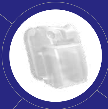
3M™ Clarity™ Ultra Brackets Autoligantes