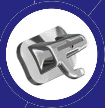
3M™ Victory Series™ Tubos Bucales de Ajuste Superior