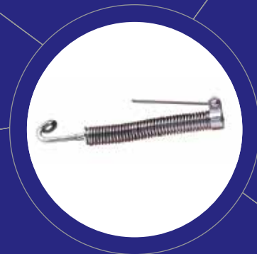
3M™ Forsus™ Correctores de Clase II