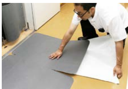
表面が平滑な床には、直接貼付が可能。 貼り替えも簡単に行えます。