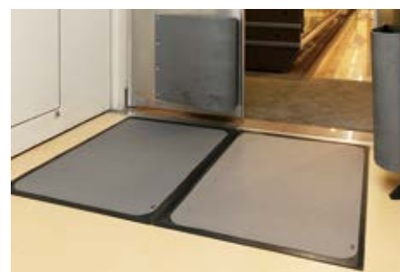
惣菜の作業場から売り場への出入口、バックヤードへの 出入口に2枚ずつ設置で効果を発揮。