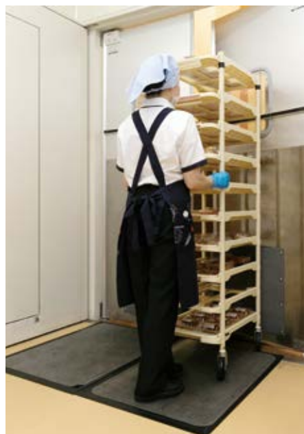
シートが薄く、表面がなめらかなので、カートの走行やスウィングドアの開閉もスムーズ。

使い勝手の面で言えば、以前の吸油マットは置くだけで粘着しないタイプだったため、ひらひらと動いてしまっていました。が、「3M™ 油取りフロアシート」は薄く、ずれないのでカートなどもスムーズに通ることができます。1枚900×600mmとサイズの扱いやすく、貼り替え作業もラクにできます。また、7月に発売された「専用ベースマット」は薄型で通行の邪魔にならず、必要に応じて移動もできるので、このマットを活用すれば、さらに使い勝手が向上すると考えています。総合的に見て、「3M™ 油取りフロアシート」の効果、使い勝手には十分満足しています。今後は、惣菜の厨房に加え、フライヤーを使用しているベーカリーの厨房にも順次、導入していく予定です。