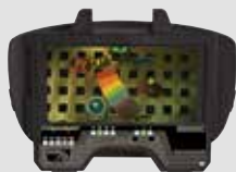
40 00 85