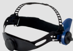
70 50 15