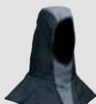
16 91 00