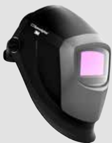
40 13 85