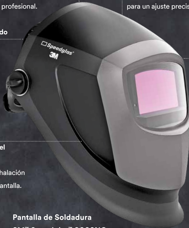
Pantalla de Soldadura 3M™ Speedglas™ 9002NC

Con salidas de exhalación integradas en la pantalla.