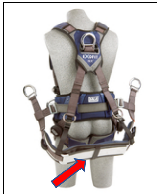
La flecha roja señala la eslinga de asiento del ejemplo

3M Fall Protection ha recibido informes que indican que la placa de refuerzo de aluminio que se usa en la eslinga de asiento puede desprenderse del tejido trenzado en ciertos arneses ExoFit™, ExoFit XP™ (incluyen los modelos para arco eléctrico) y ExoFit NEX™ (incluyen los modelos para arco eléctrico) DBI-SALA. En algunas circunstancias, la placa de asiento de aluminio se ha separado del arnés y se ha caído al suelo, lo que crea el peligro posible de una caída de un objeto. No hemos recibido ningún informe de lesiones o accidentes asociados con esta condición. El desempeño de los arneses no se ve afectado por este problema, por lo que cumplirán correctamente con su propósito en todo momento, hasta como sujeción del cuerpo para un sistema de detención de caídas personal en caso de que se produzca una caída, incluso sin la comodidad adicional que ofrece la eslinga de asiento.