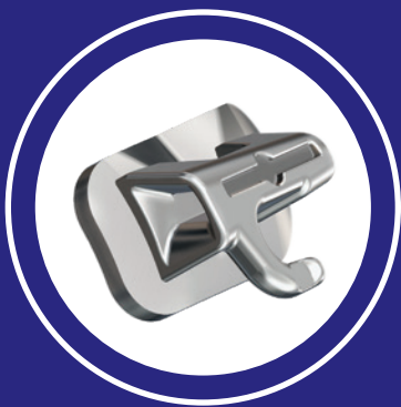
Tubes buccaux ajustables de qualité supérieure Victory Series CMC 3M MC