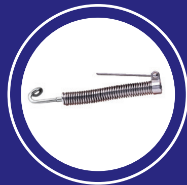
Correcteurs de classe II Forsus MC 3M MC