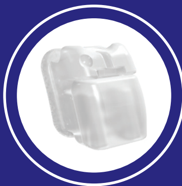
Boîtiers autoligaturants Clarity MC Ultra 3M MC