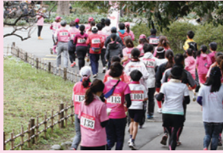
ピンクリボンウォーク 2016

認定 NPO 法人乳房健康研究会は 2000 年に発足して以降（2003 年に NPO 法人化）、ピンクリボンウォークやピンクリボンアドバイザー認定、企業とのタイアップによるキャンペーン活動など、さまざまな活動に取り組んでいます。