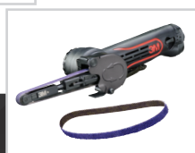
3M™ Cubitron™ II Båndsliper 786F, 10mm x 330mm, 36+, 33437A