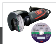
3M™ Cubitron™ II Maskin for kutteskive, 75mm x 1mm x 9.53mm, 33456A