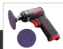
3M™ Cubitron™ II Roloc™ Slipemaskin 786C, 75mm, 36+, 33389A