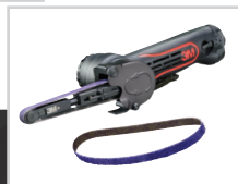
3M™ Cubitron™ II Hiomanauha 786F, 10mm x 330mm, 36+, 33437