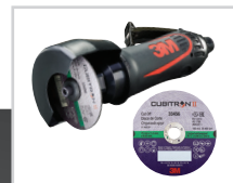
3M™ Cubitron™ II Katkaisulaikka, 75mm x 1mm x 9.53mm, 33456