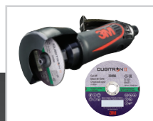
3M™ Cubitron™ II Cut-Off Wheel, 75mm x 1mm x 9.53mm, 33456