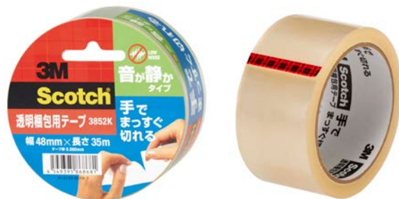
スコッチ ® 透明梱包用テープ（手でまっすぐ切れる/音が静かタイプ）

スリーエム ジャパン株式会社（本社：東京都品川区 代表取締役社長：スティーブン・ヴァンダー・ロウ）は8月1日、引き出し音が静かで、手でまっすぐ切れる「スコッチ ® 透明梱包用テープ（手でまっすぐ切れる/音が静かタイプ）」を発売します。