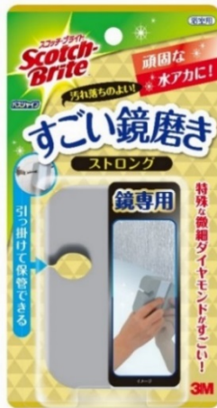
スコッチ・ブライツ™ バスシャイン™ すごい鏡磨き ストロング

スリーエム ジャパン株式会社（本社：東京都品川区 代表取締役社長：スティーブン・ヴァンダー・ロウ）は、ご家庭のトータルクリーニングブランドであるスコッチ・ブライツ™ ブランドから、浴室の鏡ケア製品「スコッチ・ブライツ™ バスシャイン™ すごい鏡磨き ストロング」、 「スコッチ・ブライツ™ バスシャイン™ くもり止めウェットシート」を8月24日に発売します。