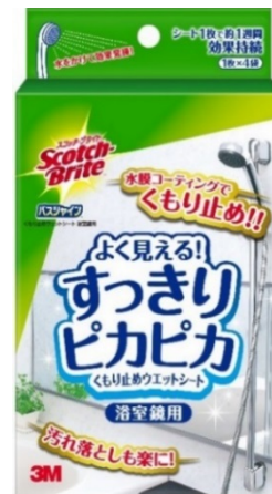
スコッチ・ブライツ™ バスシャイン™ くもり止めウェットシート