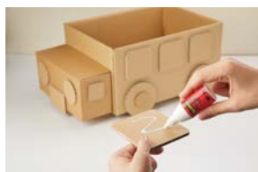
ダンボール工作に

薬品にも採用されている、密閉性が高い滴下型ボトルを採用しているため、保存性に優れています。