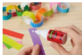
輪作りなど大量の接着作業に