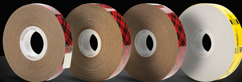
Le ruban transfert Scotch® ATG 924