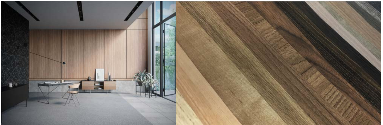
「3M™ ダイノック™ フィルム」 マットシリーズの施工イメージ

スリーエム ジャパン株式会社（本社：東京都品川区 代表取締役社長：スティーブン・ヴァンダー・ロウ）は6月12日、上質な素材感と高い意匠性を持つ粘着剤付き化粧フィルム「3M™ ダイノック™ フィルム」の新シリーズである「マットシリーズ」85点を含む225点を新たに発売します。これにより、「3M™ ダイノック™ フィルム」は全1151点※という圧倒的なラインアップと洗練されたデザインで幅広い空間作りのニーズにお応えします。*関連製品を含め