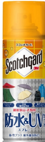
スコッチガード™ 防水&UV カットスプレー（繊維製品・衣類用）

スリーエム ジャパン株式会社（本社：東京都品川区 代表取締役社長：スティーブン・ヴァンダー・ロウ）は4月20日、UV カット機能がついた「スコッチガード™ 防水&UV カットスプレー（繊維製品・衣類用）」を発売します。