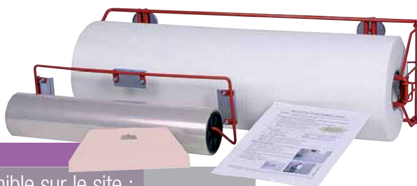
Kit d'introduction 36861

Les conditions d'utilisation et de garantie du produit sont définies par la fiche technique et régies par les conditions générales de ventes de 3M France.