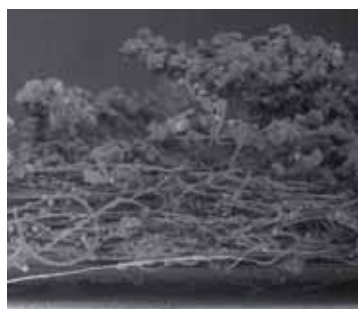
Emprisonnement de la poussière, de la saleté et des brouillards.

3M a développé un concept simple de protection des surfaces et vous apporte une solution de plus dans l'atelier !