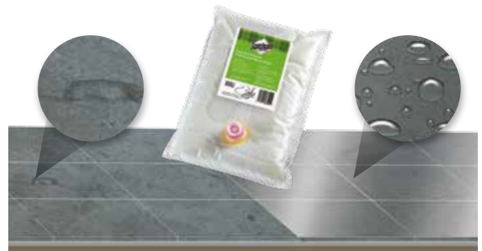
Ohne 3M™ Scotchgard™ Steinbodenschutz