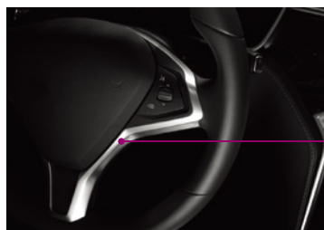
3M™ 接着剤転写テープ 9472LE (粘着剤の種類：300LSE) ステアリングへの難接着加飾トリムの固定

一般的な接着剤に比べ両面粘着テープは施工が速く、各工程を効率的に行うことができる。