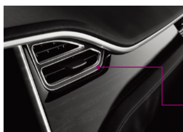
3M™ 低VOC繊維入り接着剤 転写テープ 98010LVC / 99015LVC ステアリングへの難接着加飾トリムの固定