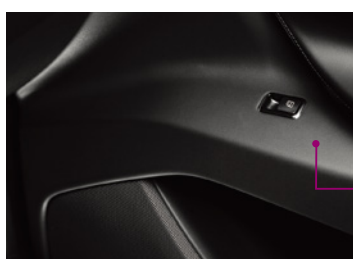
3M™ 接着剤転写テープ 9472LE (粘着剤の種類：300LSE)