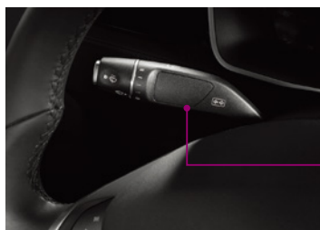
3M™ 接着剤転写テープ 468MP (粘着剤の種類：200MP) 長期耐久性が要求されるFPCの固定