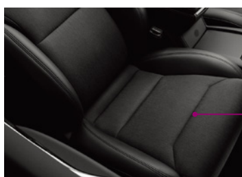
3M™ 接着剤転写テープ 6035PC (粘着剤の種類：300MP)

快適性と安全性の向上：シートエアコンの通気フィルターと着座センサーをクッション材へ固定