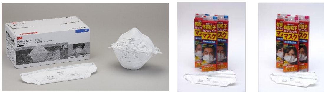
国家検定に合格した「3M™ Vフレックス™ 使い捨て式防じんマスク 9105J-DS2」 左から 20枚入りレギュラーサイズ、3枚入りレギュラーサイズ、 3枚入りスモールサイズ（9105JS-DS2）