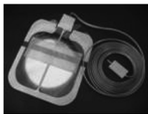
スプリットタイプ:コード付き