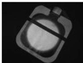
スタンダードタイプ:コードなし