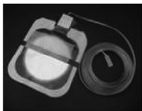
スタンダードタイプ:コード付き