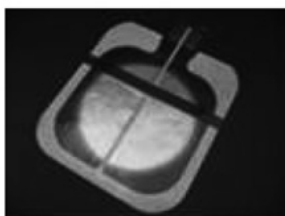
スプリットタイプ:コードなし