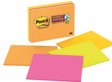
ポスト・イット® 強粘着ビッグノート