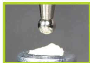
3M™ Ketac™ Universal Aplicap™

De par sa composition, 3M™ Ketac™ Universal permet une adhésion chimique à la structure dentaire mais pas aux instruments. Il est donc plus facile à manipuler et à sculpter, dès son application dans la cavité.