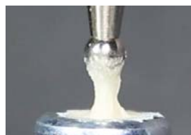
GC Equia® Fil Capsule