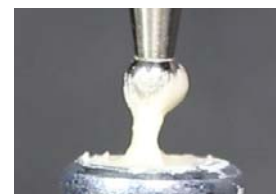
Riva Self Cure Capsule

Pour évaluer l'adhérence des ciments verres ionomères du marché, ce test visuel a été réalisé. Ainsi des fouloirs sont introduits dans un mélange non pris de CVI puis retirés immédiatement.