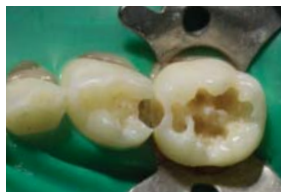
Préparation de la cavité