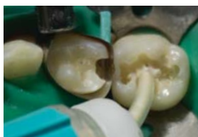
Placement en masse