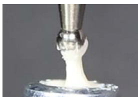
GC Fuji® IX GP Capsule