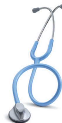
3M™ Littmann® Master Classic II fonendoskop