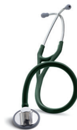
3M™ Littmann® Master Cardiology™ fonendoskop