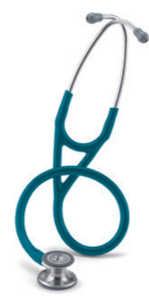
3M™ Littmann® Cardiology IV fonendoskop