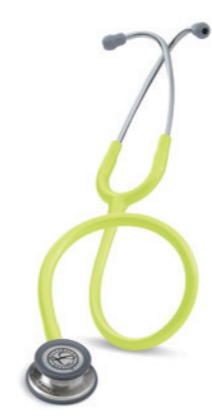
3M™ Littmann® Classic III fonendoskop