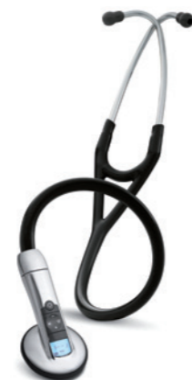
3M™ Littmann® Elektronický fonendoskop Model 3200

Model 3200 zahŕňa všetky prvky modelu 3100.