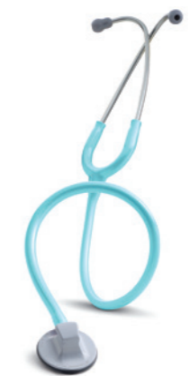
3M™ Littmann® Select fonendoskop