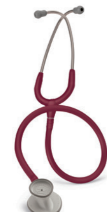
3M™ Littmann® Leightweight II S.E. fonendoskop