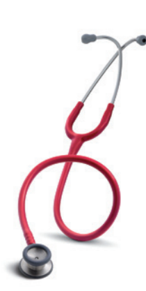
Classic II Paediatric fonendoskop (vlevo)