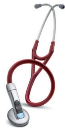
3M™ Littmann® Elektronický fonendoskop Model 3100