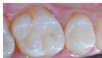
Fig. 8 : restaurations 3M ™ Filtek ™ One lors de la visite de contrôle. Les surfaces des restaurations sont lisses et brillantes pour un aspect esthétique naturel.

Cas clinique et photographies du Dr. Giuseppe Marchetti de Parme en Italie.