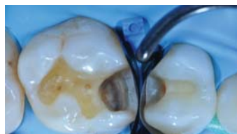
Fig. 2 : adaptation des matrices sectorielles métalliques, après préparations préalables finalisées et élimination de la lésion carieuse.