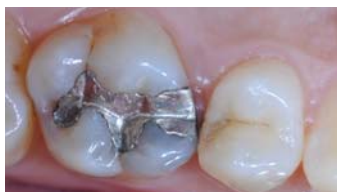
Fig. 1 : situation initiale : la 1 ère molaire présente un amalgame défectueux et la seconde prémolaire présente une carie initiale.