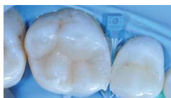
Fig. 6 : photopolymérisation des restaurations 10 secondes par face.