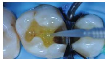
Fig. 4 : application de l'adhésif 3M ™ Scotchbond ™ Universal pendant 15 secondes, sur l'émail et la dentine et photopolymérisation pendant 10 secondes.