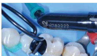
Fig. 5 : application de 3M ™ Filtek ™ One dans chaque cavité en un seul incrément jusqu'à 5 mm.