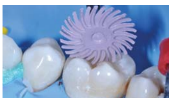
Fig. 7 : finition et polissage avec les roues spirales diamant 3M ™ Sof-Lex ™ . Résultats immédiats.