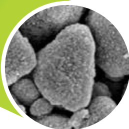
magnificación 50K de un nanocluster

Filtek Bulk Fill Restaurador para Posteriores usa la misma AUTÉNTICA tecnología de nanorrelleno que se ha probado al paso del tiempo en otros productos líderes restauradores de Filtek™. Esta tecnología no solamente contribuye a aumentar la fuerza, la excelente manipulación y a mejorar la resistencia al desgaste, sino que también ayuda a crear restauraciones que son rápidas y sencillas de pulir.