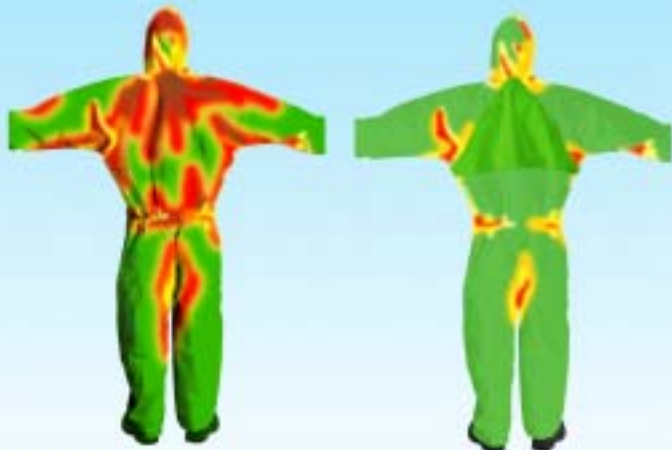
Tuta protettiva comune