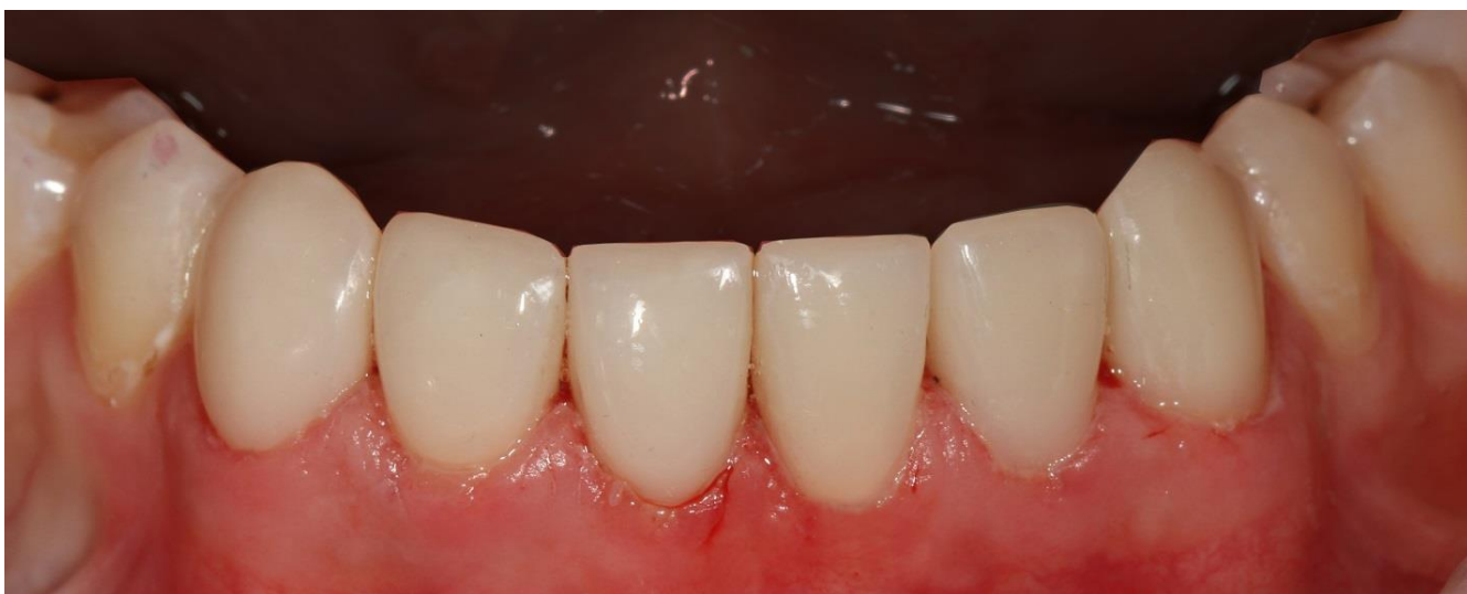
Фото 10 Финишная обработка и полировка с помощью Sof-lex дисков.