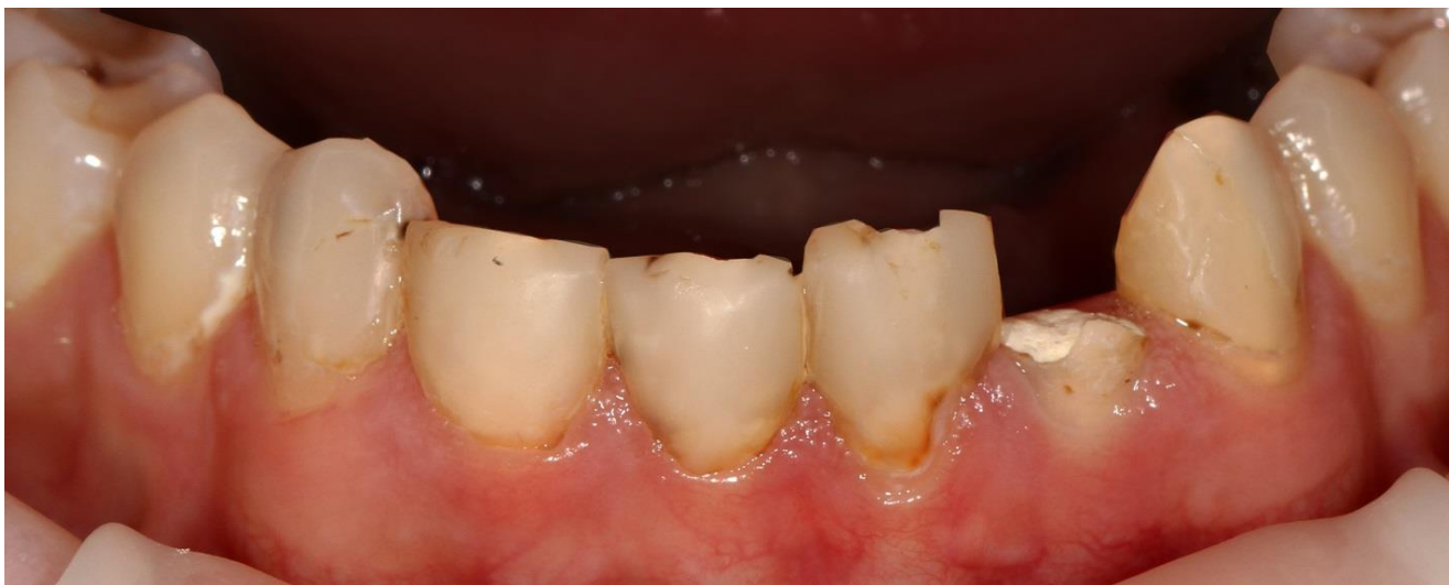
Фото 1 Исходная ситуация. Объёмные реставрации фронтальной группы зубов нижней челюсти с множественным рецидивным кариесом. Зубы закрыты временным материалом после повторной эндодонтической подготовки.

В клинику обратилась молодая пациентка, с целью улучшения эстетики в переднем отделе нижней челюсти. У пациентки ранее проводилось ортодонтическое лечение с использованием брекет-системы. На момент обращения, уже было проведено повторное лечение корневых каналов данных зубов, эндодоступ закрыт временным материалом.