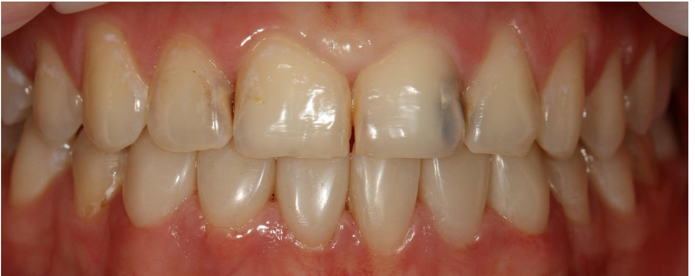
Фото 13 Оклюзионное взаимоотношение зубов.