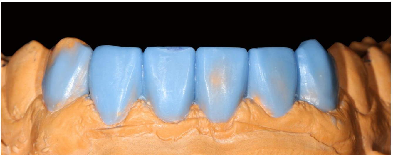
Фото 5 Восковое моделирование будущих реставраций.

Произведено снятие слепков с обеих челюстей. На полученных моделях осуществлено восковое моделирование будущих реставраций зубов 33 32 31 41 42 43. С полученной анатомии зубов снят силиконовый оттиск для воспроизведения будущей анатомии в полости рта.