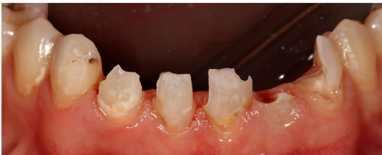
Фото 2 Объём тканей зубов после некрэктомии.

Проведена некрэктомия зубов, культи зубов восстановлены с помощью стекловолоконного штифта и композита. Пациентке было предложено провести протезирование данного сегмента с использованием цельнокерамических реставраций. Пациентка отказалась. Тогда было принято решение изготовить прямые композитные реставрации в полости рта.