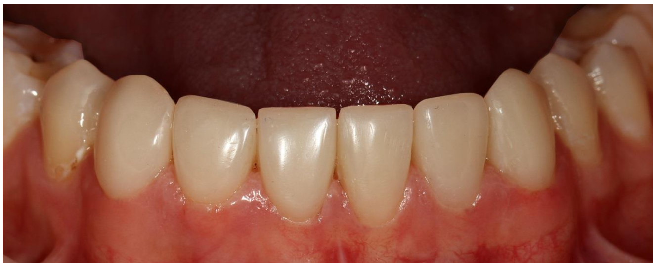
Фото 11 Вид реставраций через 4 дня.