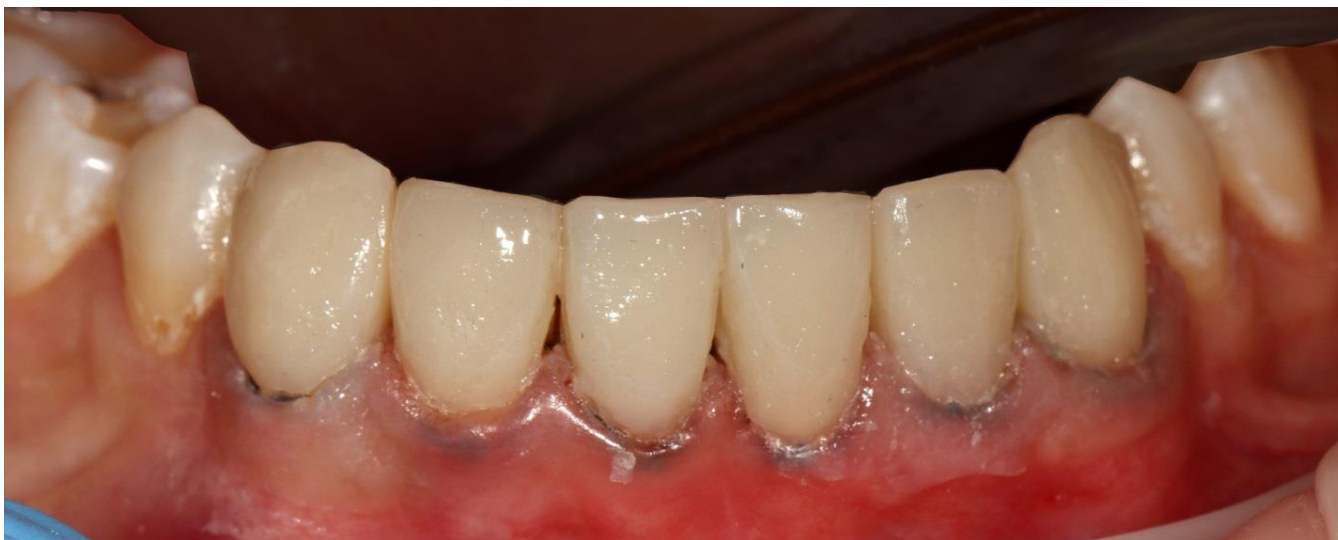
Фото 9 Послойное восстановление вестибулярной поверхности зубов с помощью оттенков Dentin A3 и Enamel A3 материала Filtek Ultimate.

Далее послойно восстанавливаем вестибулярную поверхность зуба.