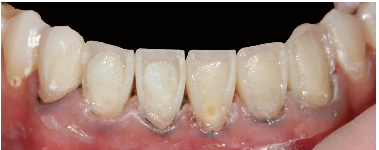
Фото 8 Восстановление аппроксимальных стенок зубов.