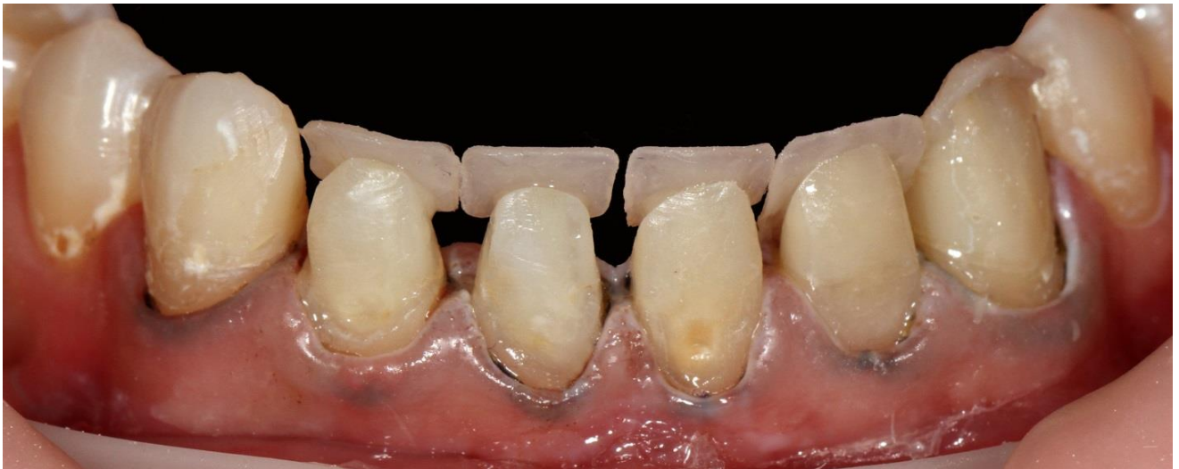
Фото 7 Поэтапное восстановление язычной стенки зубов оттенком Enamel A2 материала Filtek Ultimate. С помощью секционных матриц получаем контактные стенки зубов.

После проведения адгезивной подготовки зубов, с помощью полученного силиконового ключа осуществляется поэтапное восстановление язычной поверхности рабочих зубов.