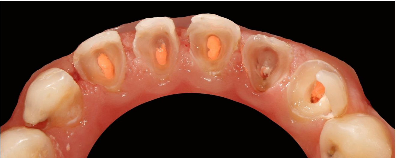
Фото 3 Язычная поверхность зубов после некрэктомии.