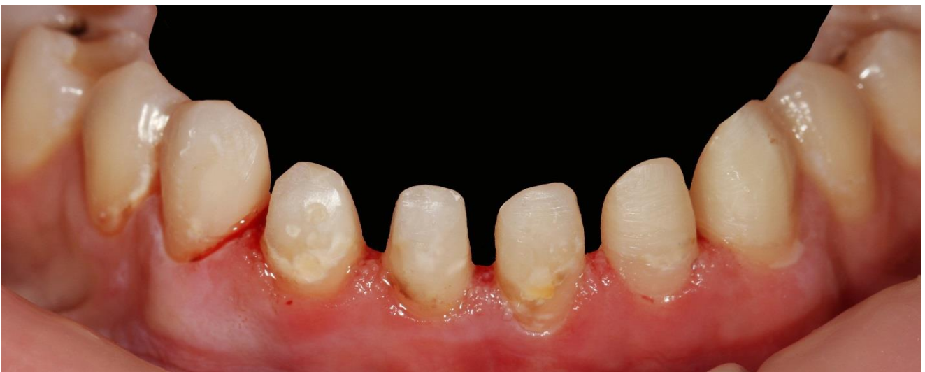
Фото 4 Восстановление культей зубов с помощью стекловолоконных штифтом и композитного материала Filtek Ultimate оттенка A3 Body.

Произведено снятие слепков с обеих челюстей. На полученных моделях осуществлено восковое моделирование будущих реставраций зубов 33 32 31 41 42 43. С полученной анатомии зубов снят силиконовый оттиск для воспроизведения будущей анатомии в полости рта.