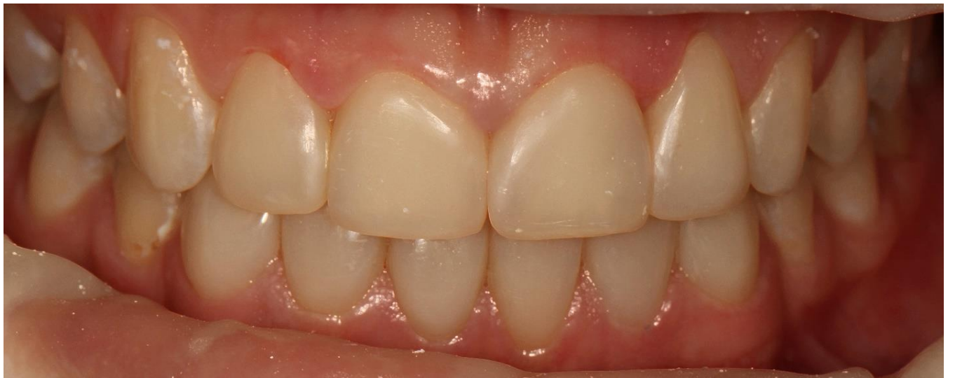
Фото 14 Вид зубов после полноценной реабилитации фронтальной группы зубов обеих челюстей с использованием композитного материала Filtek Ultimate.

Таким образом, нам удалось получить высокоэстетичные, функциональные реставрации передней группы зубов нижней челюсти в прямой технике и довольную пациентку.