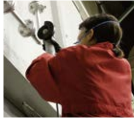
高い所の作業でも、今までより疲れません。

力をかけなくても、早く切れます。女性や、力の入りにくい上向きの作業でも軽く切れるので、従来のディスクに比べて、はるかに疲れません。