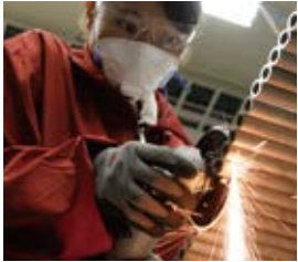
横から当てて切っても、軽い力で気持ちよく切れます。