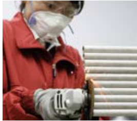
上向きにもラクに切れます。