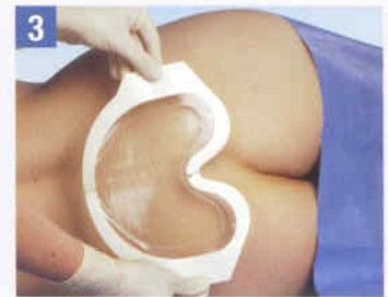
3. Die Transparenz ermöglicht eine exakte Positionierung über der Wunde.