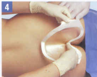
4. Platzieren Sie den Verband im steilen Winkel zuerst mittig in der Analfalte.