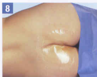
8. Angelegter Tegaderm Absorbent Sakralverband.