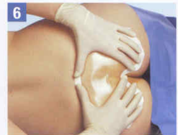
6. Halten Sie den Kleberand ca. 10-15 Sekunden gedrückt, um die Klebkraft zu optimieren.