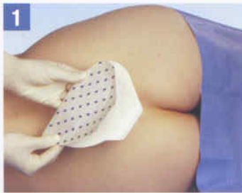
1. Die Haut muss trocken und fettfrei sein. Falten Sie den Verband in der Mitte.