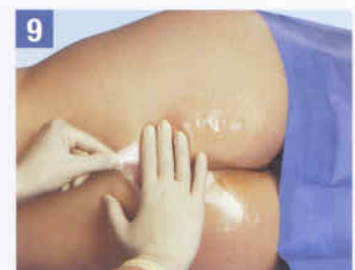
9. Zur Entfernung überdehnen Sie den transparenten Kleberand waagrecht zur Haut und unterstützen Sie diese dabei mit leichtem Druck. Alternativ kann der Verband auch vorsichtig und flach abgezogen werden.