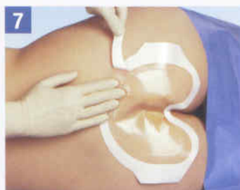
7. Ziehen Sie den Applikationsrahmen flach nach außen ab und streichen Sie die Kleberänder abschließend an.