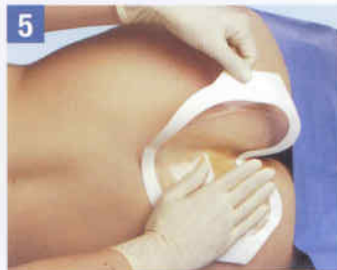
5. Modellieren Sie den Verband von der Mitte nach außen an.