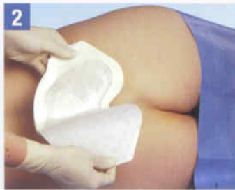
2. Halten Sie den gefalteten Verband an den klebstofffreien Laschen und entfernen Sie das Trägerpapier.